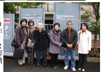
10年 JR 要請